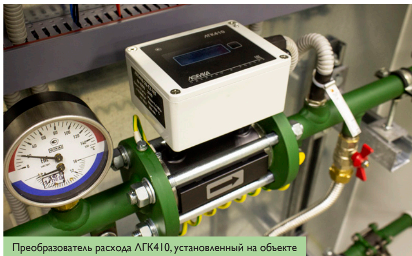
Преобразователь расхода ЛГК410, установленный на объекте

Расходомер ждали. И это вполне объяснимо, поскольку его достоинства говорят сами за себя: ЛГК410 учитывает расход жидкости как в прямом, так и